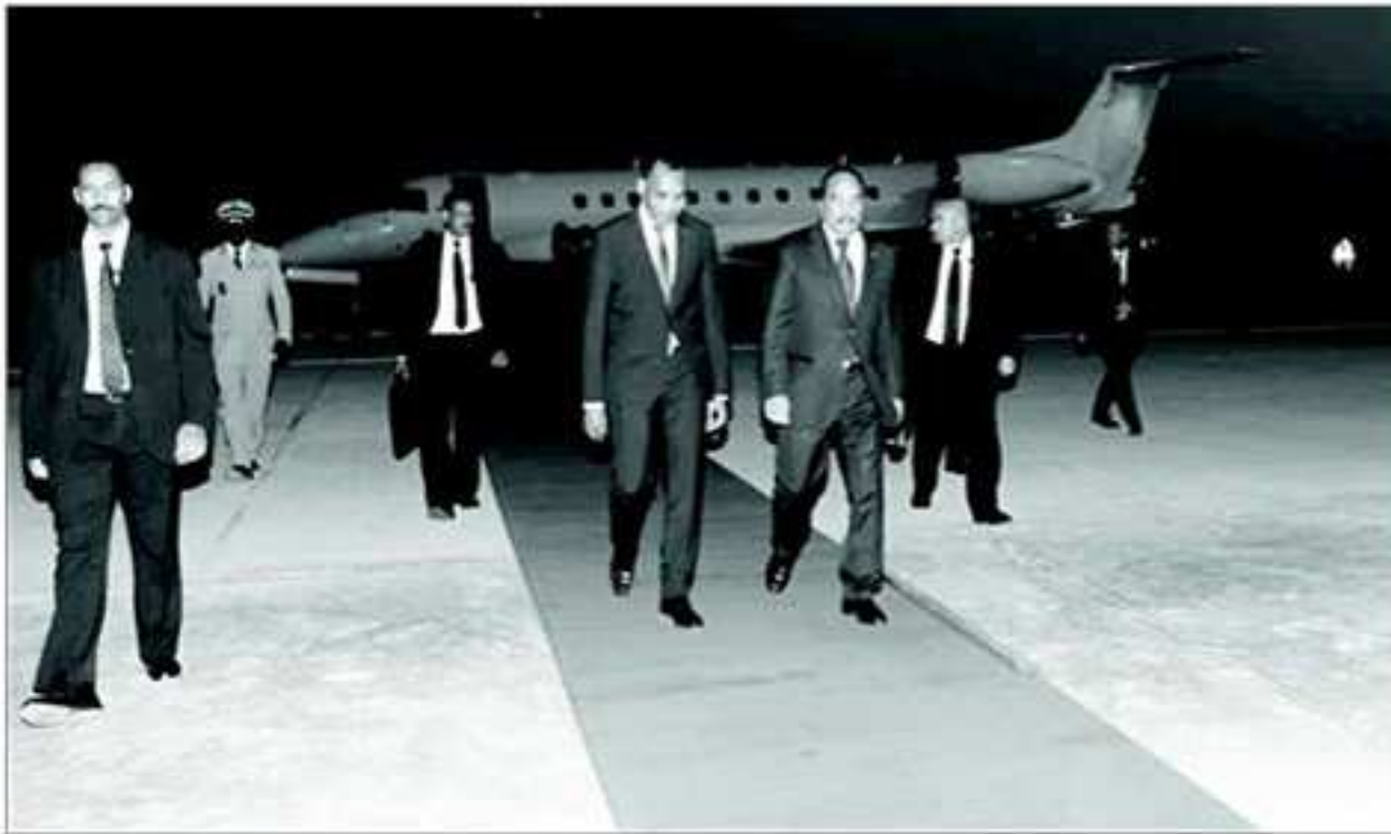
Etats Arabes, M. Ahmed Aboul Gheit et ses collaborateurs pour la bonne organisation de notre actuel sommet.

Je voudrais d'abord présenter mes sincères remerciements à mon frère, Son Excellence Monsieur Béji Kaïd Essebsi, Président de la République sœur de Tunisie et à travers lui, au peuple et au gouvernement tunisiens pour l'attention dont nous avons fait l'objet et pour l'hospitalité généreuse qui nous a été réservée, avant de féliciter Son excellence pour la présidence de notre actuel sommet et pour la bonne organisation de ce dernier. Je voudrais, également, exprimer ma grande considération et louer hautement les efforts appréciables déployés, en faveur des intérêts vitaux de notre Nation, par notre frère le Gardien des Lieux saints, Sa Majesté le Roi Selmane Ibn Abdel Aziz Al Saoud, Roi d'Arabie Saoudite au cours de sa présidence réussie de la 29 e session du sommet arabe. Il m'est, aussi, agréable de féliciter le secrétaire général de la Ligue des