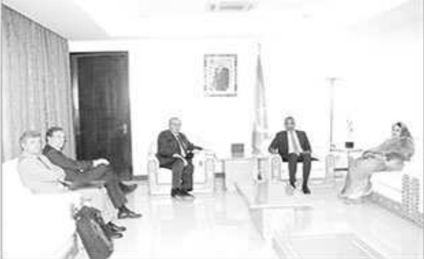
Le Premier ministre, Monsieur Mohamed Salem Ould Béchir, a reçu en audience, vendredi à Nouakchott, une délégation européenne, conduite