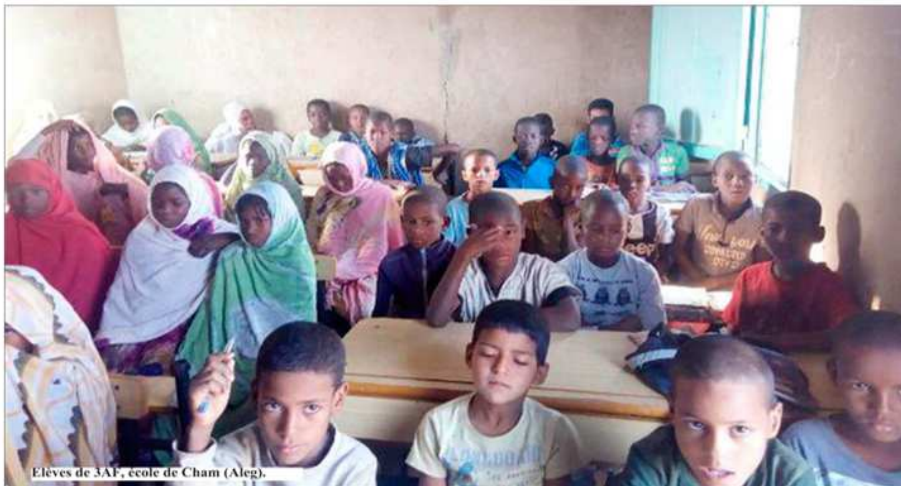
Elèves de 3AF, école de Cham (Aleg).

A Bouraat, la situation a changé. Une école et un poste de santé ont été construits il y a quelques années pour favoriser le regroupement de citoyens (dont l'unique tort) est d'être nés pauvres. Les conditions de scolarisation des enfants ont changé mais pas le résultat : sans moyens de subsistance autres que la force de