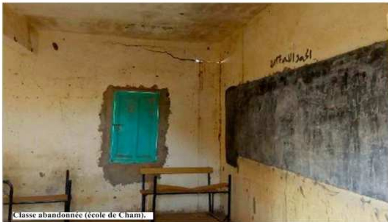
Classe abandonnée (école de Cham).

Au niveau du secondaire, la « palme » de la déperdition revient à Bababé dont les taux sont les plus faibles au niveau des cinq départements de la wilaya, avec un taux brut de scolarisation au secondaire de 17% et un taux net de seulement 14%.