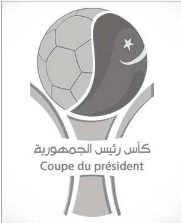
Le tirage au sort des premier et deuxième tours de la coupe du président de la République (édition 2020-2021) se déroule, aujourd'hui lundi (3 mai), à 16 h, au siège de la FFRIM, selon une annonce faite par la Ligue nationale de football (LNF).