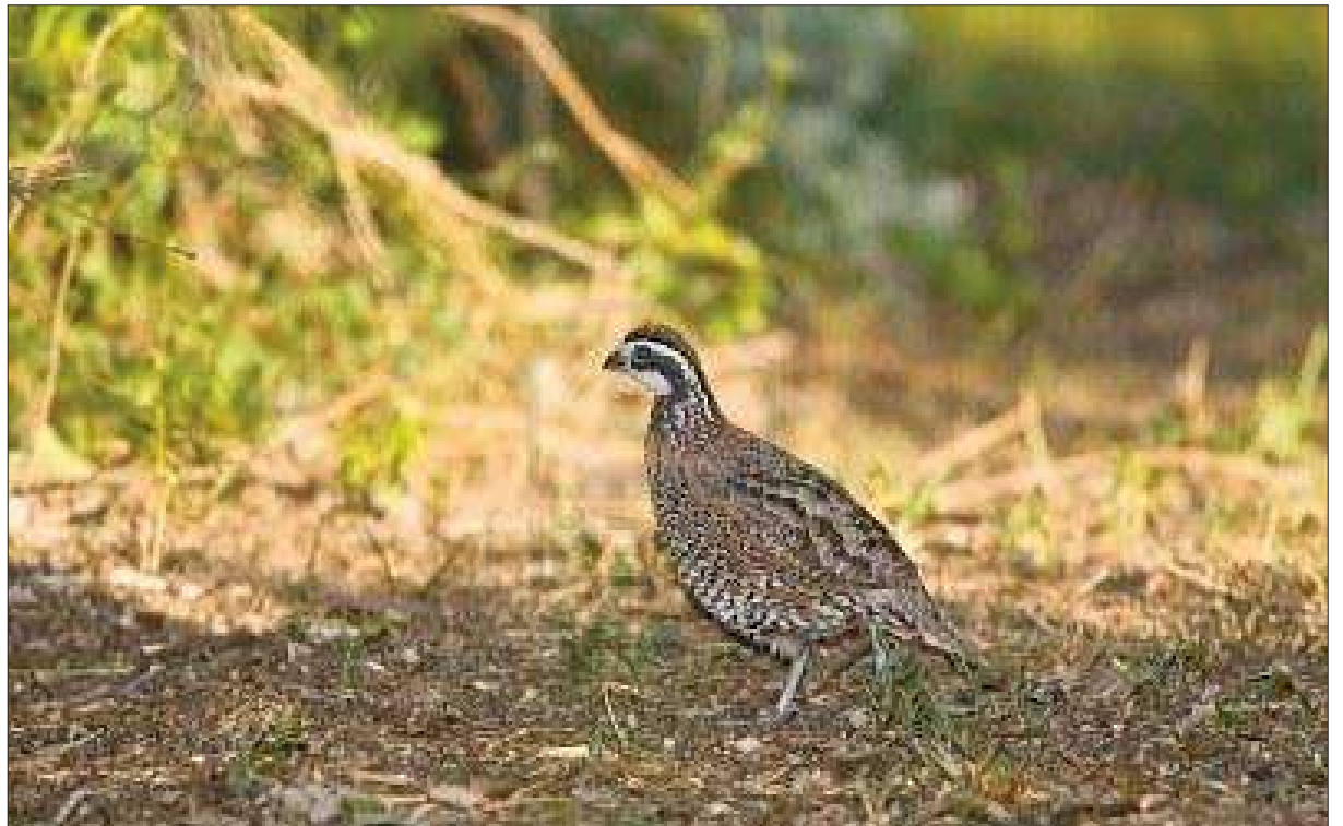
Une expérience incroyable au Cameroun

C'est vrai ! Si une cure dure 7 semaines, cela fait pour un adulte un total de 240 œufs à s'avalier. C'est sûrement très bon pour la santé, mais un peu contraignant ! Il existe donc plusieurs marques que l'on peut se procurer sur Internet et qui offrent des extraits standardisés secs qui évitent de surcharger ses menus. Mais rien ne remplace la cure authentique.